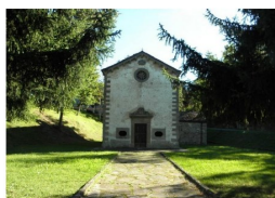
Oratorio "madonna della neve" - Cavola